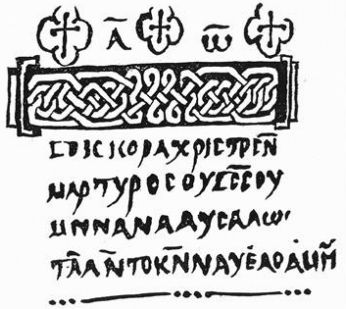
Nubische Schrift In: Shinnie, P.L. 1996:127

Aus aktuellem Anlass ist es sinnvoll, daran zu erinnern, dass das Christentum ursprünglich nicht in der westlichen Welt entstand, sondern dass sich seine Ausbreitung von Palästina aus nach Asien, Europa und auch nach Afrika hin vollzogen hat. Dafür sind sowohl Ägypten als auch Nordafrika, Äthiopien und Nubien mit ihren jeweiligen Kirchen als sprechende Beispiele zu nennen. Der Fokus in diesem Artikel liegt auf der Kirche, die im mittleren Niltal, zwischen dem ersten und sechsten Katarakt, den wir heute Nubien nennen, entstand. Zu oft wurde in der Vergangenheit vergessen, dass sich ab dem 6. Jh. n.Chr. in Nubien eine blühende Kirche entwickelte, die viele Jahrhunderte Bestand hatte und erst zu Beginn des 14. Jh. n.Chr. durch die islamische Eroberung Nubiens einen graduellen Niedergang erlebte.